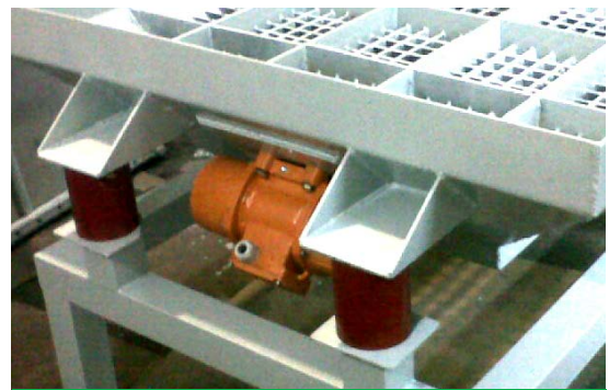
Aplicación de los tacos en mesa de desmoldeo.

Este diseño evita la colocación de resortes, los cuales ocasionan desgaste y rotura prematura.